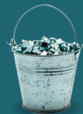
FILO DI ACCIAIO ARMONICO DAL RICICLO DI ROTTAMI FERROSI

Drop è quella goccia di felicità che notte dopo notte mai ti abbandonerà.